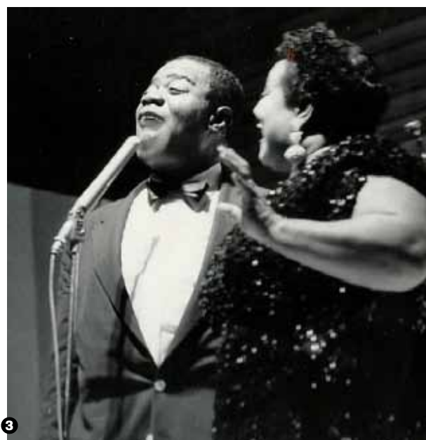
1 Trummy Young och Louis Armstrong – lägg märke till Borås Atletklubbs märke på väggen. 2 Count Basies storband fyllde skolans scen. 3 Louis Armstrong och sångerskan Velma Middleton blev snabbt favoriter för Boråspubliken. 4 Joe Williams, sångare i Basies band. 5 Det märktes även i BT att några av jazzens giganter kom till stan.